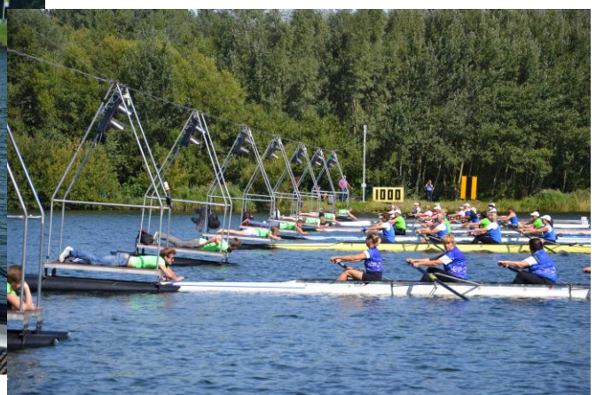
Startbokse fra Hazewinkel