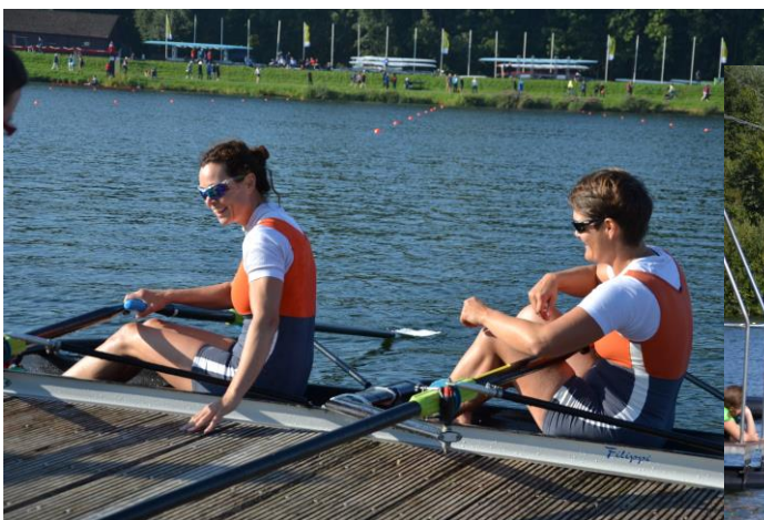
2 stk. verdensmestre fra Danmark

Søndag er helt speciel. Her ror man kun mix løb. Altså blandede hold med kvinder og mænd fra forskellige klubber. Der er en helt speciel stemning og glæde denne dag. Det er fest på vandet, men tag ikke fejl – man vil altså vinde de mix løb, så ingen kommer sovende til en medalje – heller ikke søndag.