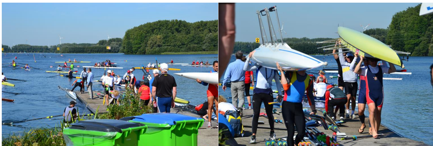
Travlhed på en af pontonerne

Jeg så engang en dyreudsendelse om bladskærer myrer fra Sydamerika. Det er en myrerart der kravler op i træerne og skærer blade i stykker, for at bære dem tilbage til deres bo, for at aflevere dem, så de kan bruges til at dyrke svampe med, som de så lever af. Et myrdrer af trafik frem og tilbage med blade i tusindvis. Det samme sker til et så stort regatta. Myretuen er søen, myrerne er alle roerne, og bådene er alle bladene. Men det er præcis det samme virvar frem og tilbage. Der er hele dagen en livlig trafik på søen, men ligeså mange både er enten på vej i søen eller på vej op på land – klar til næste tur. Der er årer og både overalt hvor der er bare den mindste plads.