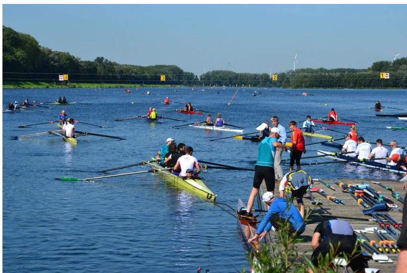
Travlhed på søen – og her er det kun lidt travlhed.

Selve regattaen foregik over 4 dage. Og der er altid fra tidlig morgen til omkring kl. 18.30 om aftenen 2 løb i gang på banen hele tiden. Hver enkel klasse er inddelt i heat med 8 både i hvert heat. Hver heat har en vinder, som kan kalde sig verdensmester, og fik en medalje. Jeg stillede op i 1x i C klassen, hvor der var 16 heat. Det betød at 16 \times 8 = 128 personer stillede op i den klasse. Tænk så på alle de mange forskellige bådtyper der findes, som igen er inddelt i klasser, som igen er inddelt i heat. Det er et vildt program.