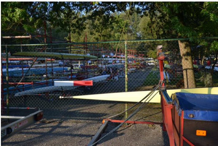
Et lille udsnit af de stativer der var overalt til stævnet

penge. Mærker som "Empacher", "Filippi", "Wintech", "Hudson" ses overalt, men der findes mange andre mærker, og en del stiller op i gamle både lavet i træ. Kommer man langvejsfra, eller bare vil ro i noget af det bedste udstyr der findes, kan det lade sig gøre ved at leje både, fra "Filippi" som har en stand hvor de lejer både ud til alle stævner.